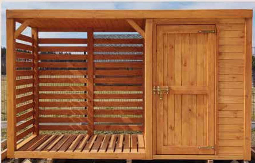
1. Drzwi - boazeria pionowa (standard)