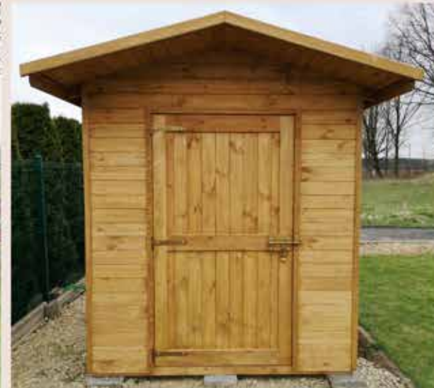
5. Drzwi poszerzane do 100cm (tylko w domkach narzędziowych)