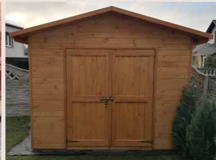
6. Drzwi podwójne