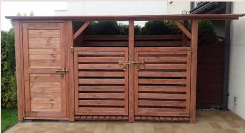
2. Drzwi - boazeria pozioma