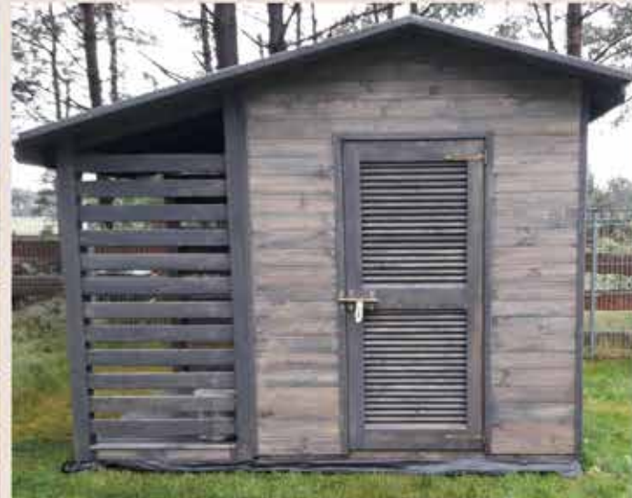
3. Drzwi - żaluzja C bez prześwitu, drobna